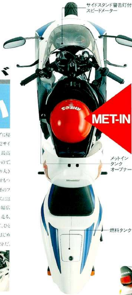
サイドスタンド警告灯付 スピードメーター