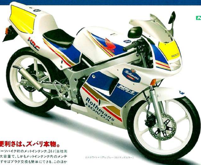
ロスワイトメリアルブルー（ロスマンズカラー）

水冷2サイクルの単気筒エンジンが生み出すパワーは最高出力7.2馬力。低速トルクも十分だから、立ち上がりも実にスムーズ。このほか、剛性感としなやかさを併せ持つツインチューブフレーム、大径のフロントフォーク、リアモノサスペンション、フロント・リアのディスクブレーキ、幅広チューブレスタイヤ、6本スポークホイール、ステンレスカバードサイレンサー、など。まさに、運動神経のかたまりました。